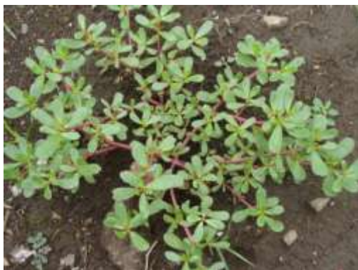
畑の雑草④ (スベリヒユ)