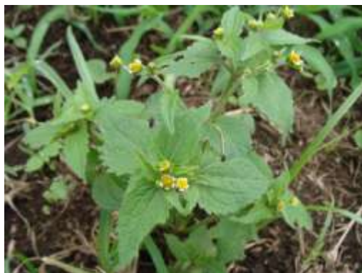
畑の雑草③ (ハキダメギク)

植生(本誌279号参照)とはまったく異なり、荒地地型群落ではなく、典型的な畑地雑草群落のパターンを示しています。それはすなわち、かつてここに麦畑や家庭菜園があった頃の植物社会に戻ったということを示していま