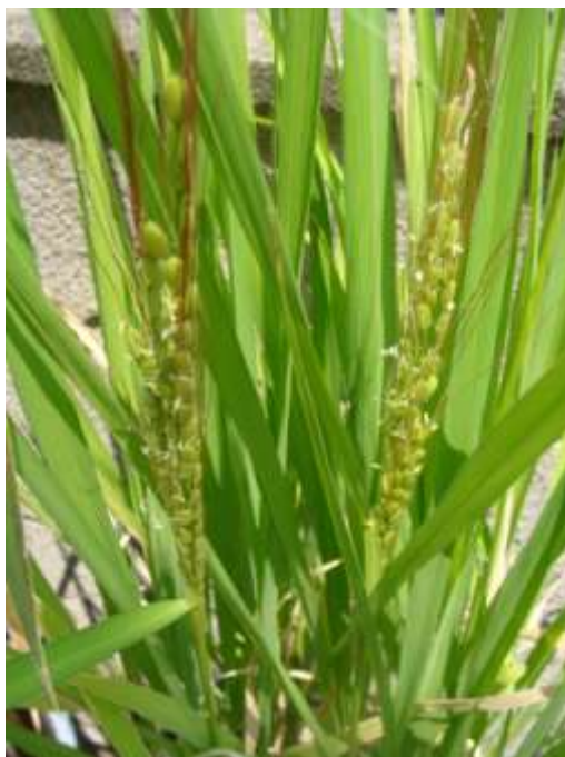
写真9 赤米稲の開花

ものの2～3時間で、穂はスルスルと伸び出して完全に止め葉の根元から離れ、ピンとまっすぐに立った状態で、その全容をあらわします。時には長い芒が茎の先端部にひっかかって、うまく出穂できないこともありますが、人間が手伝ってやらなくとも、自然に内側から押し出されていきますので、放っておきましょう。農家では稲穂を傷つけることのないようにと、出穂・開花時には決して田