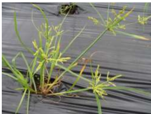
畑の雑草② (カヤツリグサ)