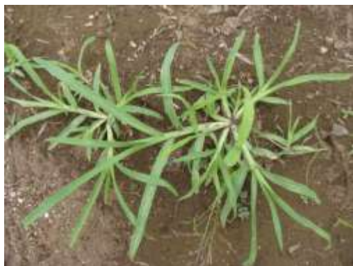
畑の雑草① (オヒシバ)